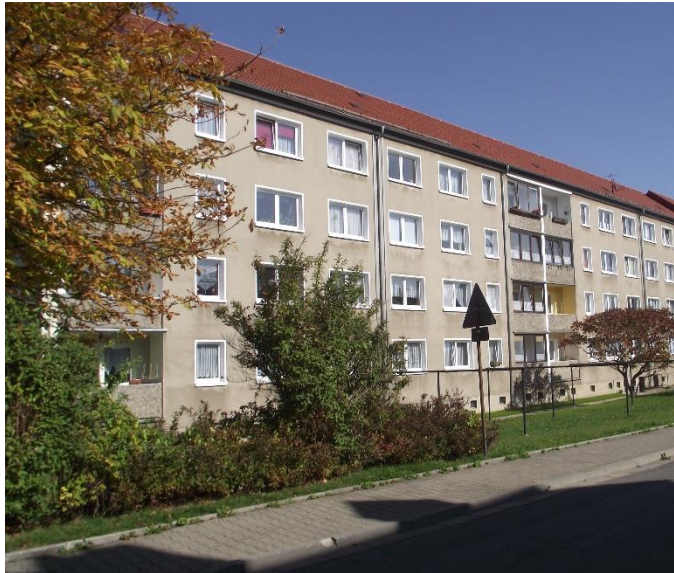
Die Grundrisse haben nur musterergültigen Charakter und sind zur Maßentnahme nicht geeignet.